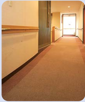
お部屋までの緩やかなスロープ。