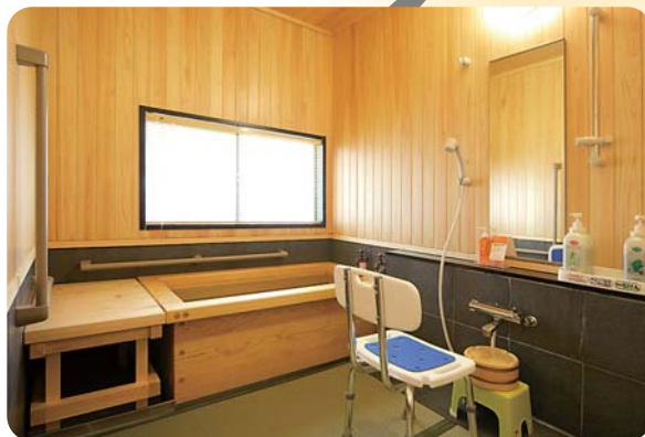
畳敷きの浴室、湯舟の奥と左に手すりがあります。