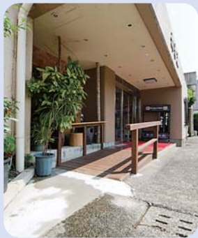
玄関入口のスロープ。