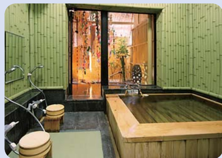
中庭付きの家族風呂もあります。