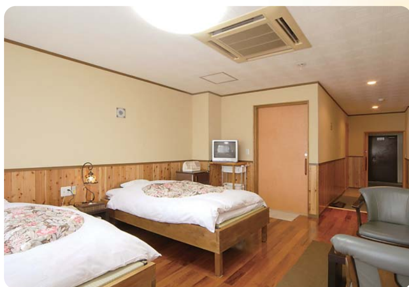
シングルベッド2台