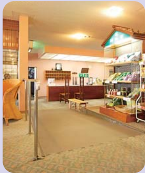
ロビー横スロープ。