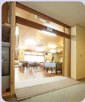
お食事処でのお食事となります。