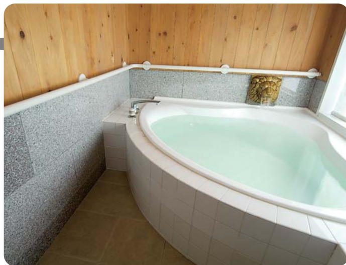
浴室入口から湯舟まで腰高の手すりが続いています。