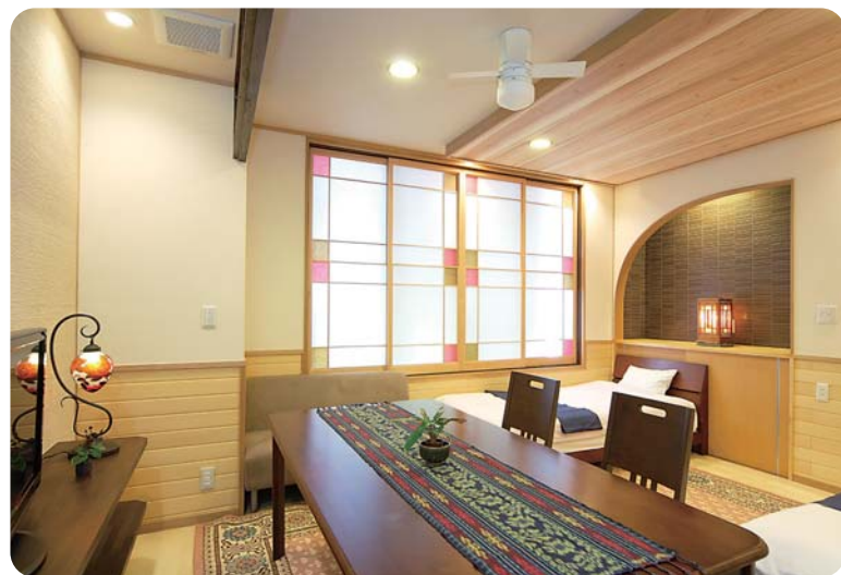
シングルベッド2台で間が広々。 テーブルといすは移動できます。