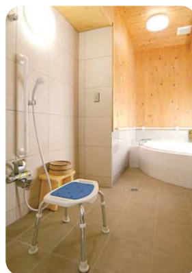
シャワーチェアあります。 立ち上がる時の手すりも完備。