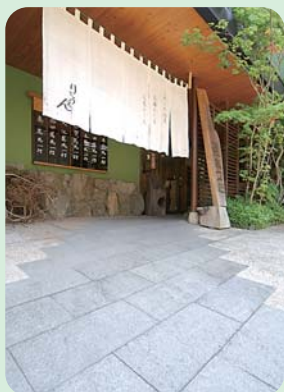
玄関前まで車を入れられます。