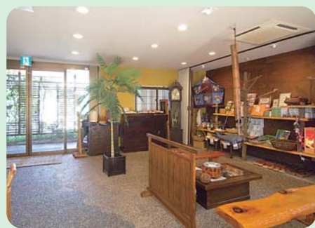
古民家風のロビー。おみやげ売場にはおしゃれな和雑貨が並びます。