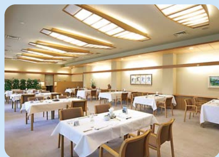
広々としたレストラン。