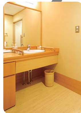
車いすでも入れる洗面台。