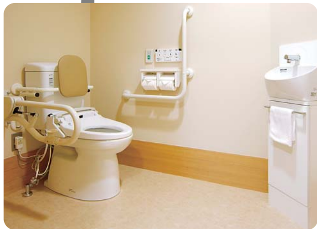
背もたれがついたトイレ。左の手すりは可動式です。