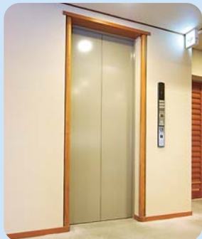
中に手すりがついたエレベータ。