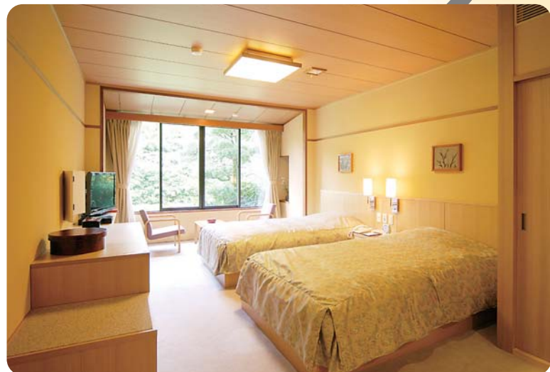
セミダブルベッド2台。うち1台はギャッジベッドです。 広い窓から見える景色はまさに癒しです。