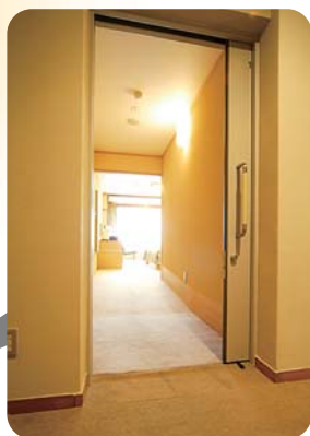
部屋入口。 入ってすぐスロープがあります。