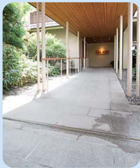
玄関までのスロープ。