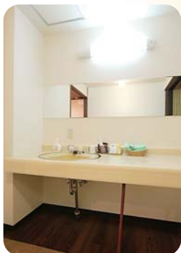
ゆったりした洗面所は、ご家族並んでお使いになれます。

10畳の和室に、こたつスペースもあります。簡易ベッドとテーブル、いすが必要な場合はご予約時にお申し付け下さい。ベッド、テーブル、いすをセットした場合はこのようになります。