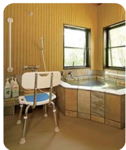
洗い場が畳敷きの浴室と、洗面台。