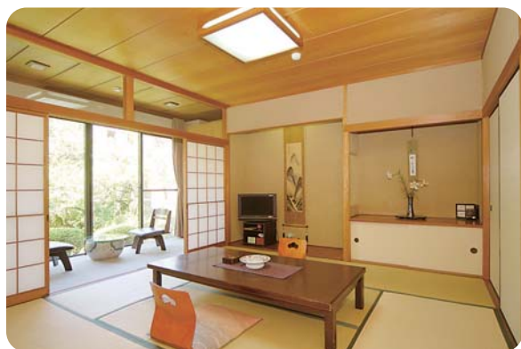
12畳広い和室に、縁があり、美しい中庭がご覧になれます。 簡易ベッドご利用になれます。