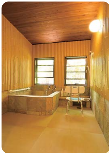
洗い場が畳敷きの浴室。