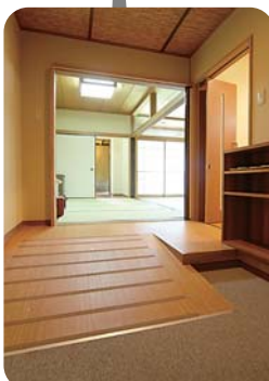
部屋入口にスロープがあります。