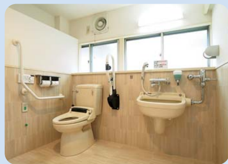
「みんなのトイレ」を設置しています。 オストメイトあり。